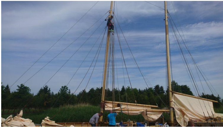
... ja nüüd on Andrus juba mastikorvis