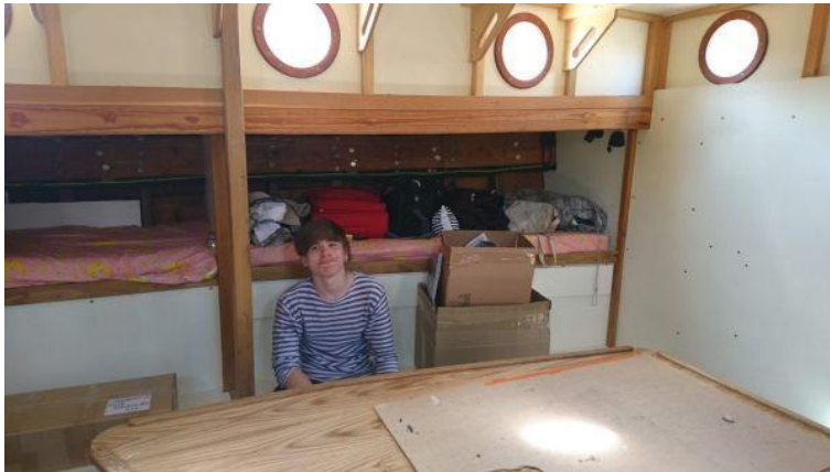
Nii näeb välja veel korrastamist vajav Ingli ühiskajut