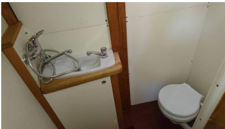
Ingliilt ei puudu ka mugavused