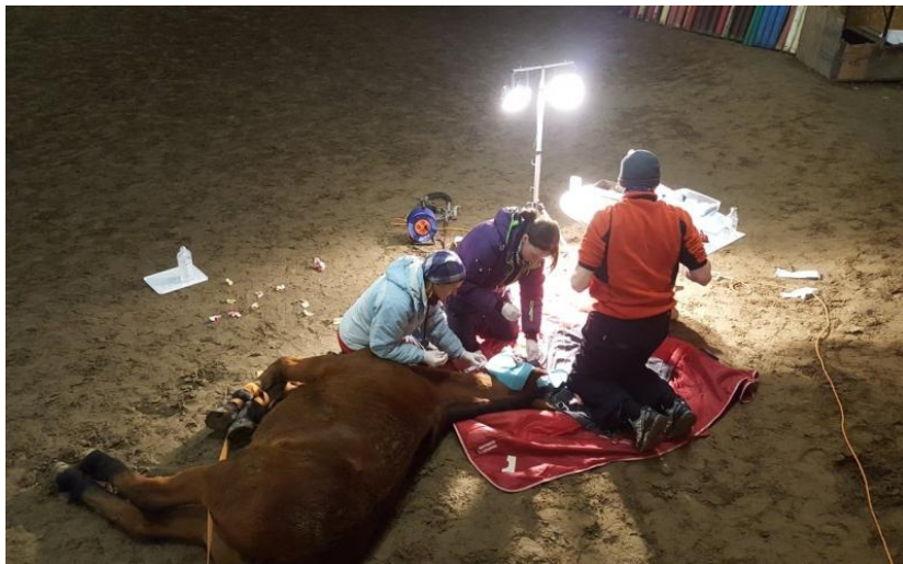
Abi saavad suured loomad