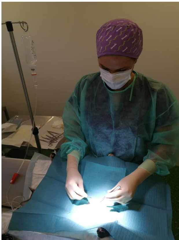
Pildil väikeloomale tehtav operatsioon