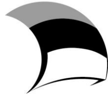
Eesti tuleviku heaks