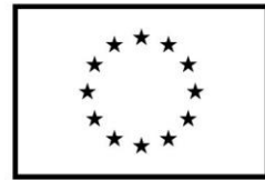
Kaasrahanud Euroopa Liit