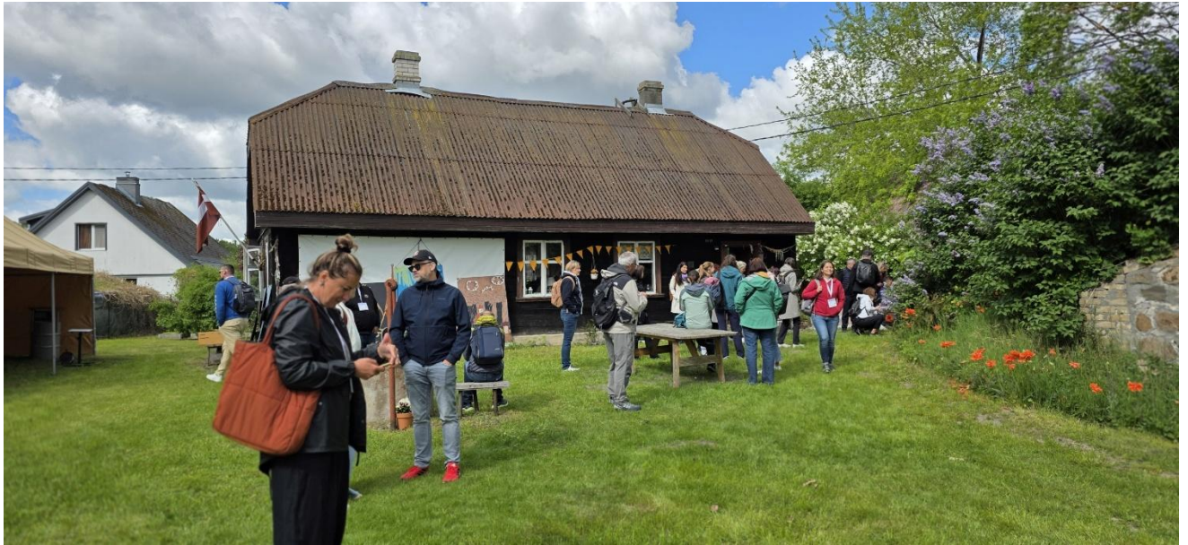
Kanierise järve looduspark: